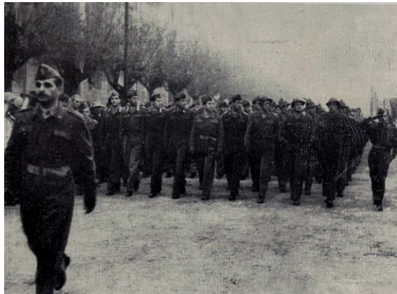
Modena, Viale dei Caduti : 120 Sottotenenti del 2° Corso Ordinario e del Corso straordinario combattenti sfilano davanti al Capo dello Stato

Nel suo discorso, il Comandante dell'Accademia, Generale di Brigata Gildo Verna, dopo aver ripercorso le tormentate vicende dell'Istituto in quegli ultimi anni e le sofferenze subite dal Palazzo ed aver espresso la gioia e riconoscenza dell'Accademia per essere onorata della presenza del Capo dello Stato nel giorno della ufficiale riapertura a Modena, ebbe modo anche di sottolineare la coincidenza di tale evento con la consegna della Medaglia d'Oro al gonfalone della città, avvicinemento non causale proprio perché il Palazzo Ducale, durante l'occupazione tedesca, fu luogo di prigionia di molti partigiani.