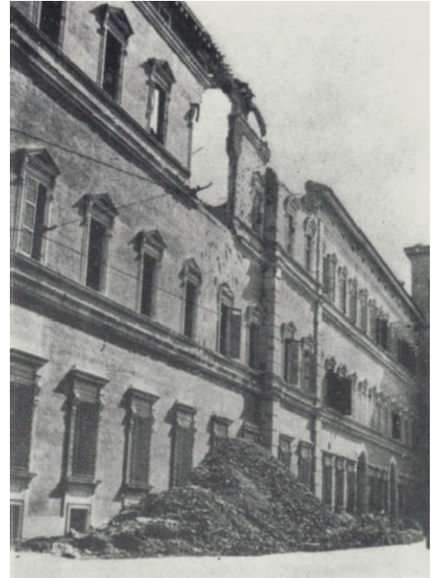
Bombardamento aereo 1944: danni al Palazzo Ducale sul lato Via 3 Febbraio

Malgrado le offese belliche ed i danneggiamenti subiti dal Palazzo Ducale e dalle altre strutture del comprensorio, la sede modenese sarebbe stata comunque in grado di riappropriarsi della originaria funzione, disponendo di tutti i requisiti e le capacità necessarie, sia in termini di ricettività alloggiativa che di potenzialità addestrative e, soprattutto, di decoro e prestigio per l'Istituto di formazione militare più antico al mondo.