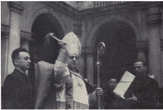
L'ordinario Militare impartisce la benedizione