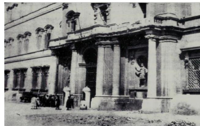
Bombardamento aereo: danni al balcone di Piazza Roma

Già sul finire del 1945, conclusa la guerra di Liberazione, lo Stato Maggiore dell'Esercito si era posto il problema della ricollocazione definitiva dell'Accademia Militare, divenuta nel frattempo