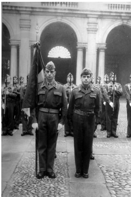
1947 - Gruppo Bandiera dell'Accademia

Il 1° novembre gli allievi del 2° e 3° Corso ordinario riprendevano la loro attività nella sede storica di Modena.